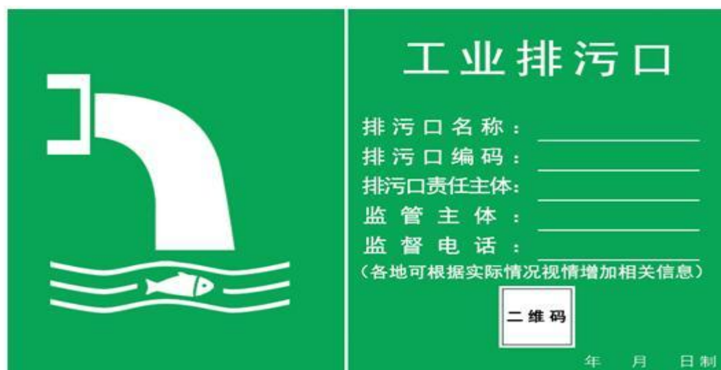
图 7.2.3-1 标志牌面参考例图

制作和日常维护中，应注意标志牌无明显变形，表面无气泡、开裂、脱落及其他破损，图案清晰，色泽一致，无明显缺损。