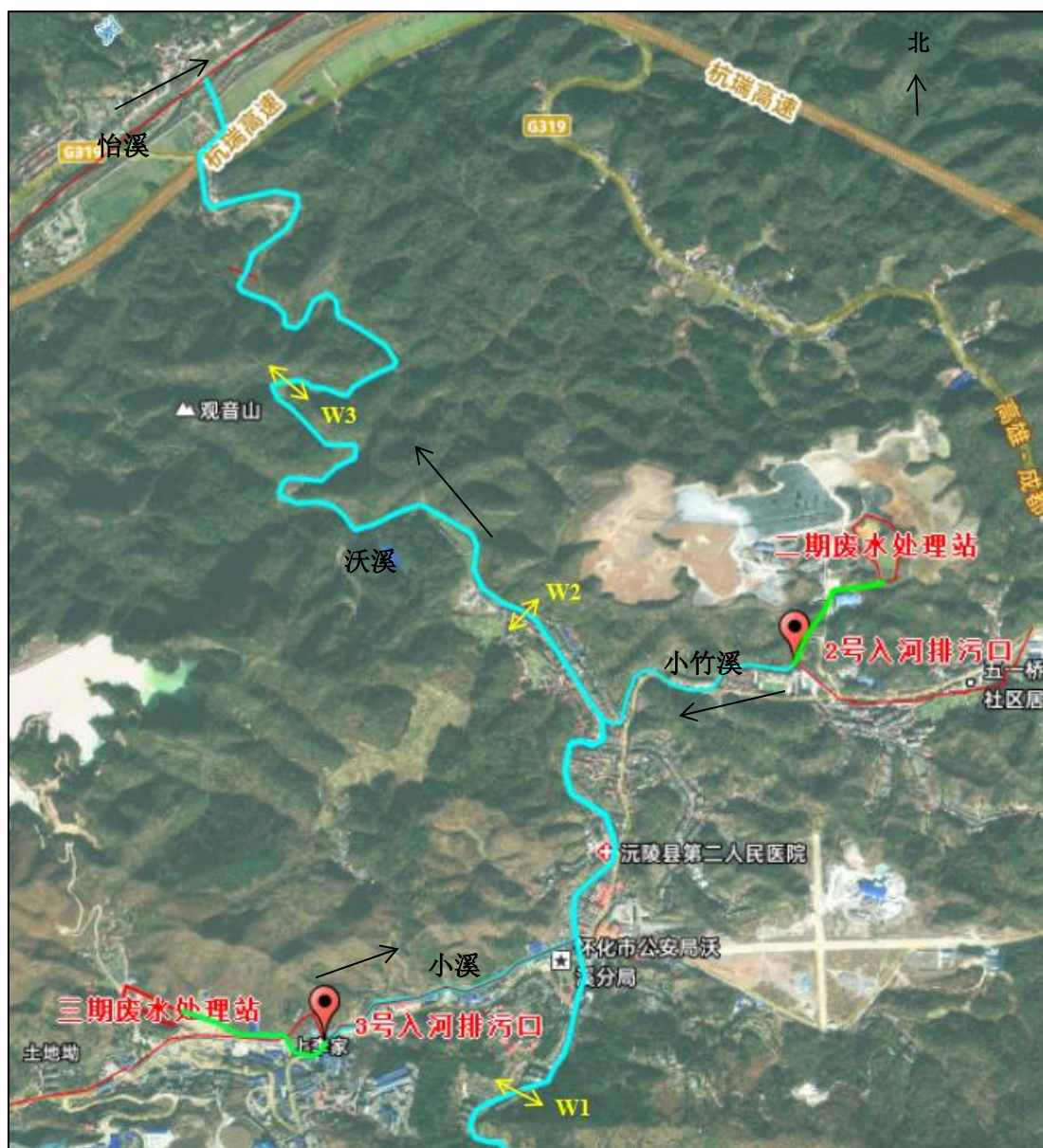
图 3.1-1 沃溪地表水水质监测断面布设情况图