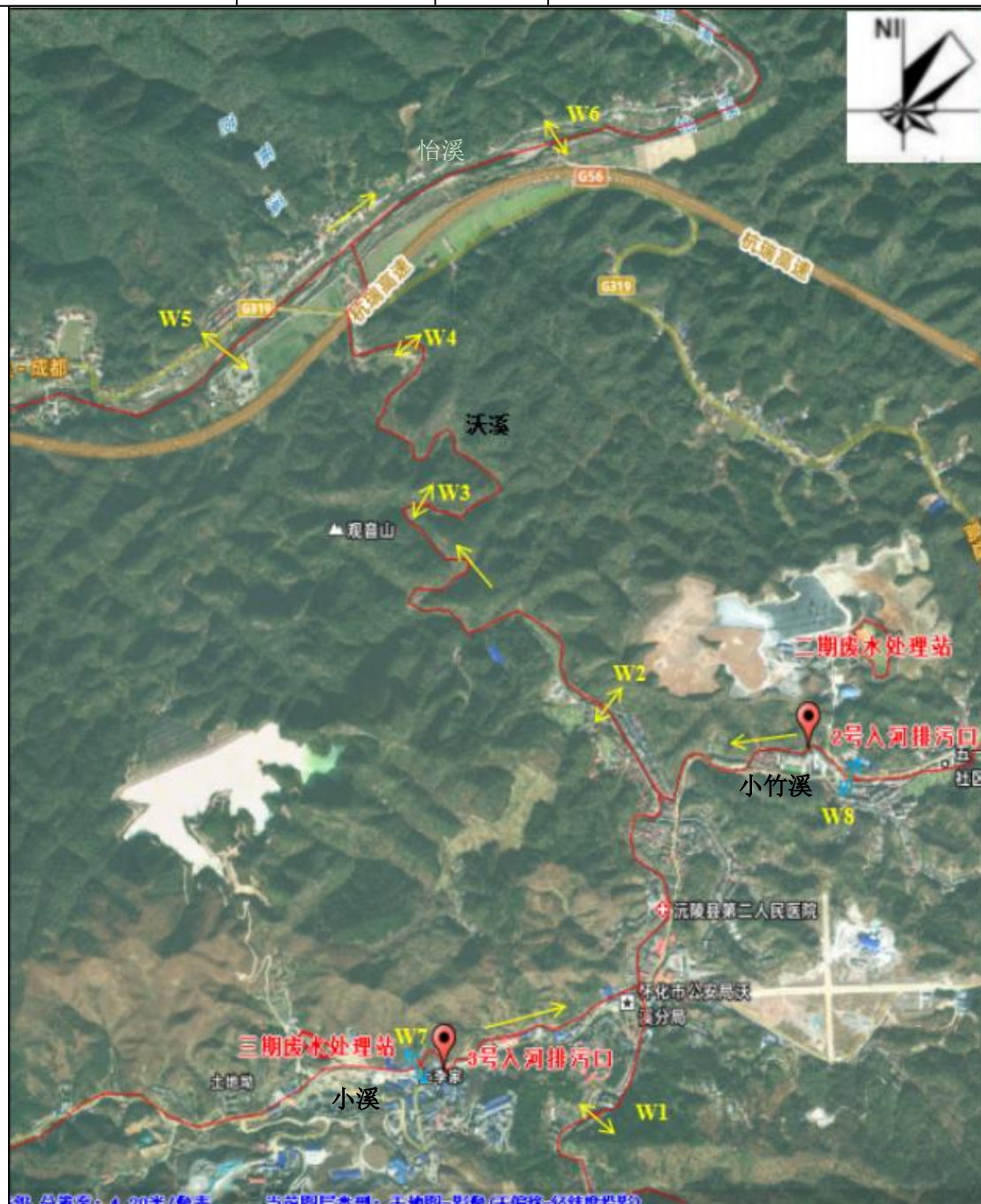
图3.1-2 沃溪及支流地表水水质监测断面布设情况图